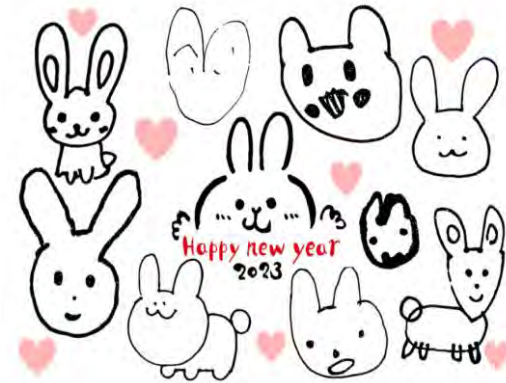
大領 COCORO 生活介護