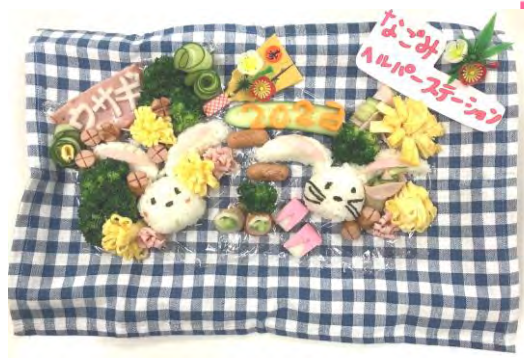
なごみヘルパーステーション