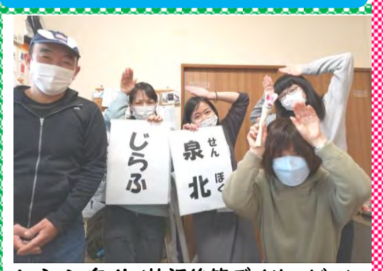
じらふ泉北(放課後等デイサービス)