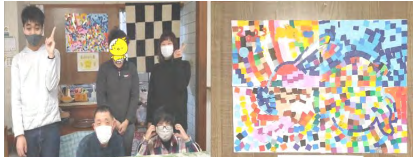
謹賀新年 2023 地域活動支援センター コロたま倶楽部 コロたま倶楽部「カフェコロたま」

総セン通所：就労継続支援 「べらしお福祉・コブンカフェ」 オガリ作業所：就労継続支援 「手づくりショップパンプ」