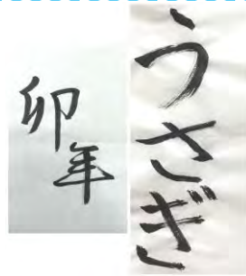
こころの相談ネットふうが