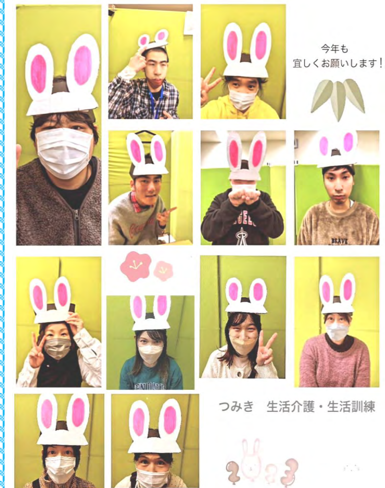
今年も宜しくお願いします!