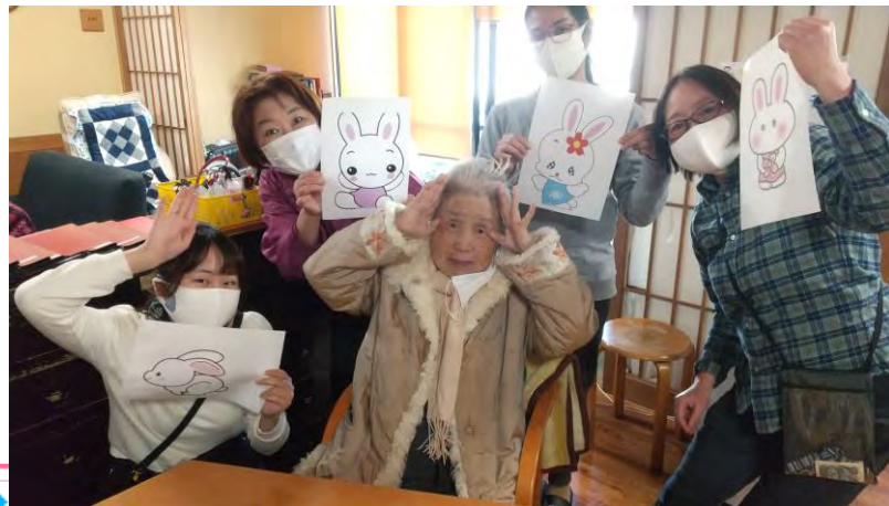
じらふデイ(放課後等デイサービス)