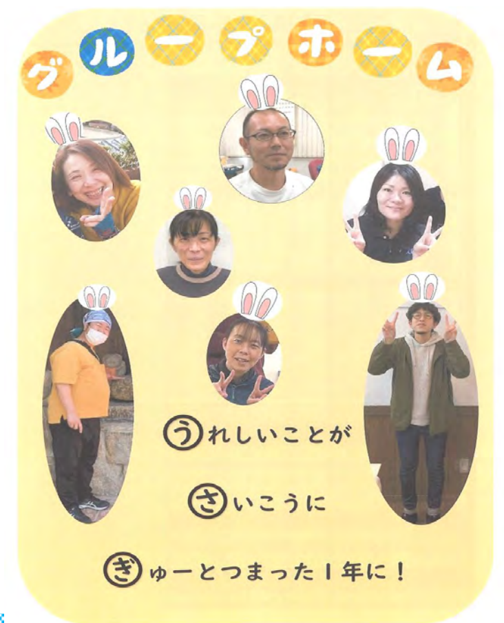
障がいグループホーム