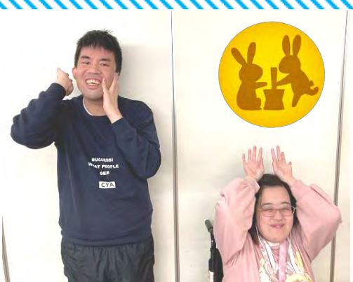
オガリ作業所生活介護