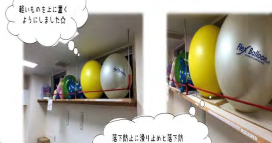
軽いものの上に置くようにしました☆