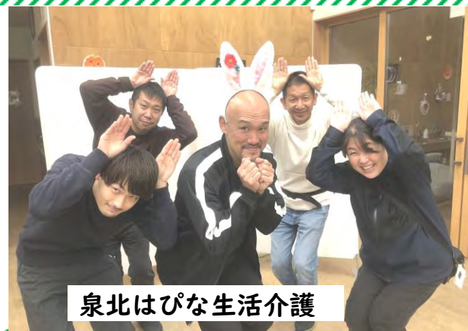
泉北はびな生活介護