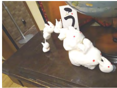
なごみデイサービス