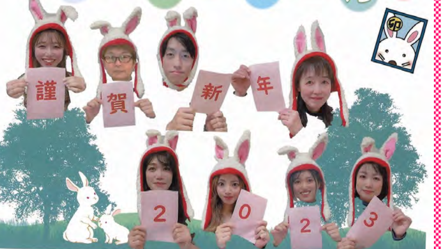
住吉区北地域包括支援センター・住吉区地域見守り支援事業(CSW)