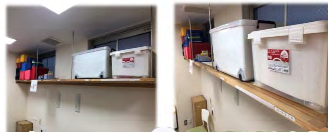
うえに重いものをおく、落下したときにケガをするリスクがあります。