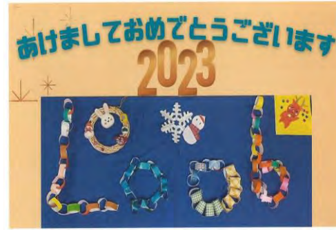
大領地域の家であい生活介護(るーぶ班)