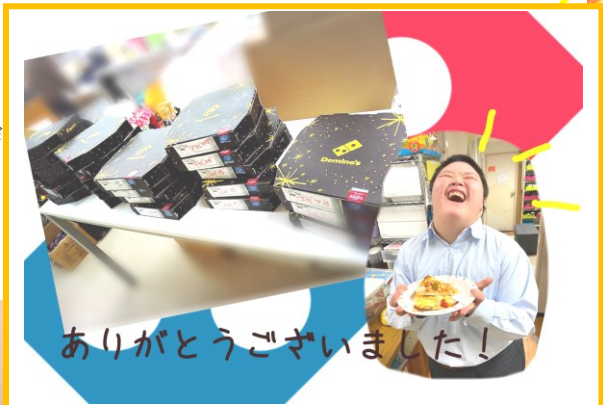
ありがとうございました！

新型コロナウイルス感染拡大の時期で、緊張感続く職場内ですが、おいしいピザを届けて頂き、職員一同感謝です。ありがとうございました。