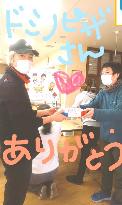
ありがとうございます