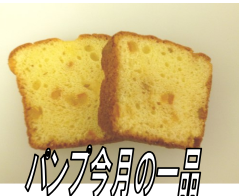
パンフ今月の一品

パンフいちおしのバニラパウンドケーキです。 風味豊かなバニラ味に、オレンジピールのアクセントがきいています。 お子さまのおやつに、ホワイトデーの贈り物にいかがでしょうか。