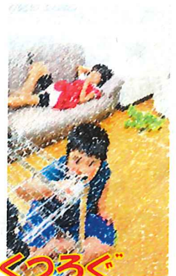
“あそぶ”と“くつろぐ”