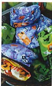
ハロウィンのおかしのプレゼントも★