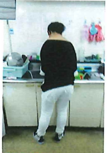
食器洗い ありがとう m(_)_m